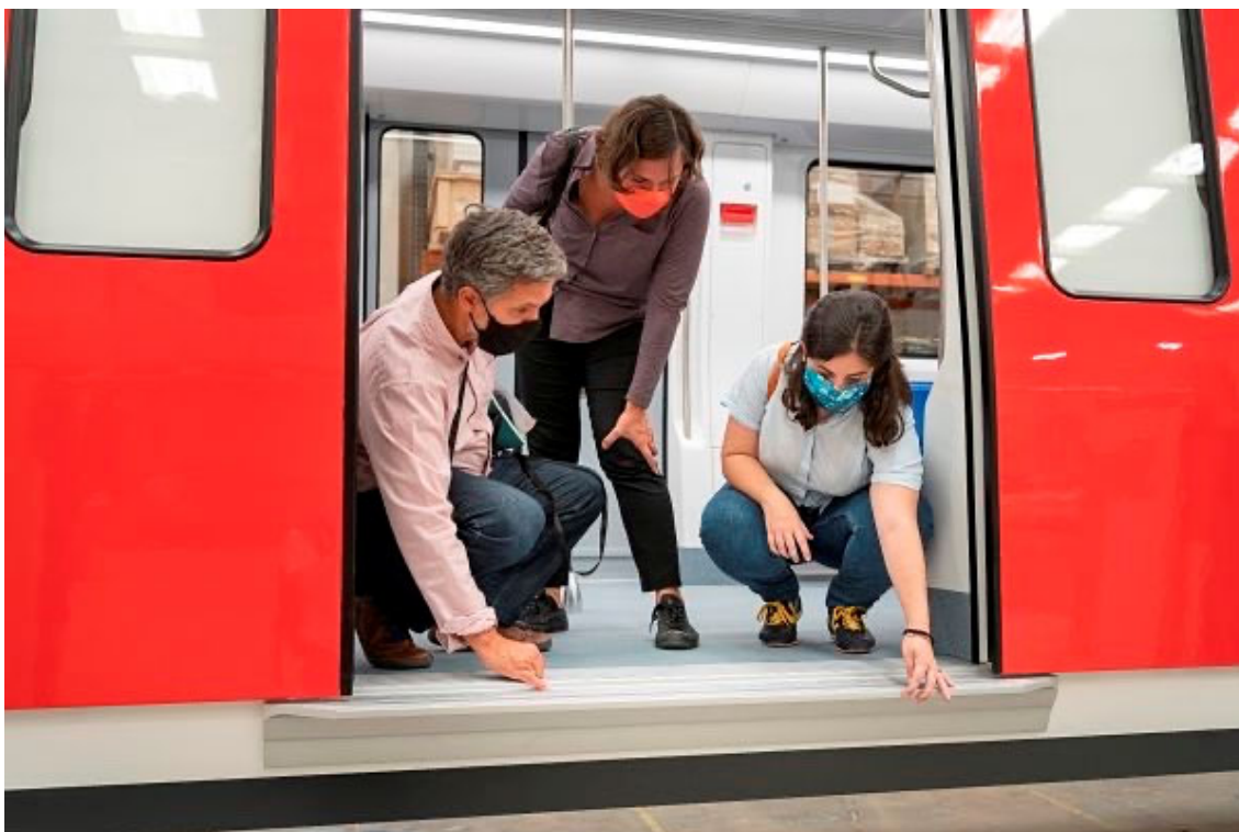
Equipo técnico del Servicio de Accesibilidad Universal de TMB revisando las características de los nuevos trenes.