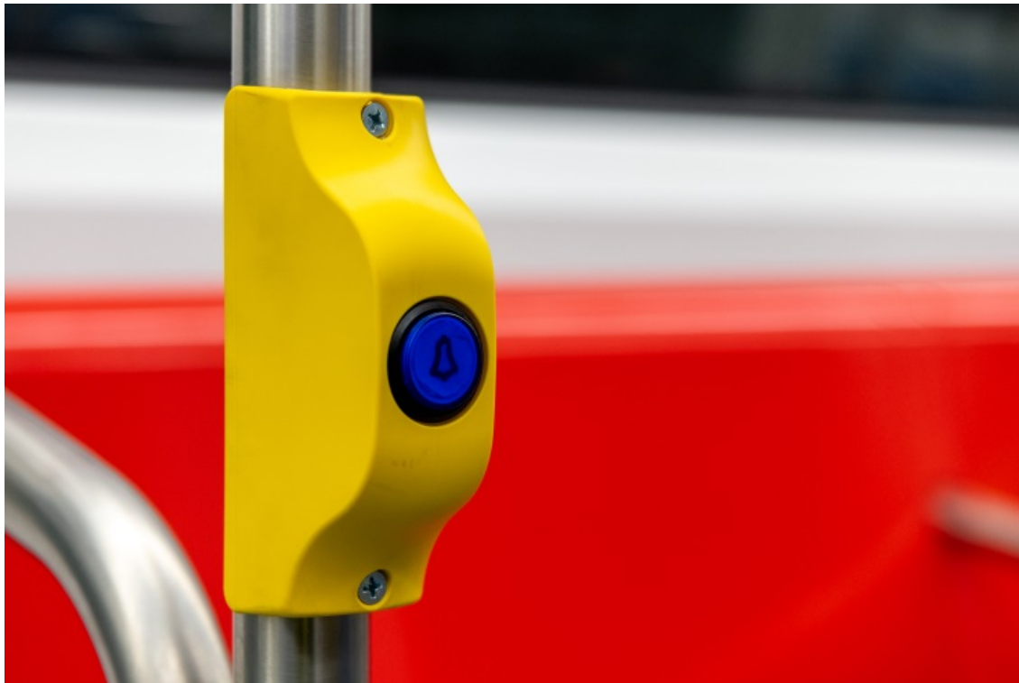
Detalle del pulsador integrado en dichos asientos para las personas con movilidad reducida.