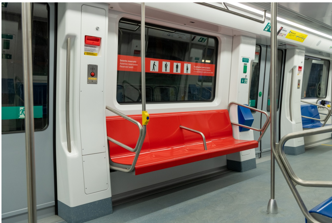
Imagen del nuevo diseño para los asientos reservados