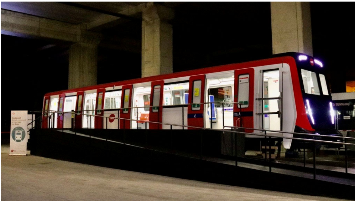
Vista de la maqueta a escala real de los nuevos trenes de TMB que hemos podido poner a disposición de las entidades gracias a Alstom.