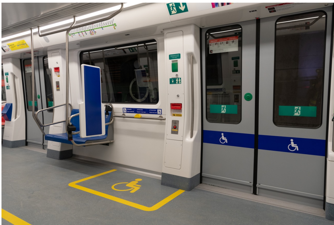
Imagen del nuevo diseño del espacio reservado para personas usuarias de sillas de ruedas.