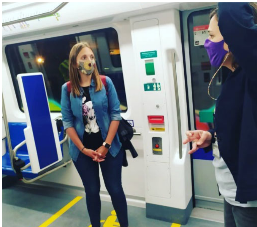
Personal de la Oficina Técnica de Accesibilidad de TMB, junto a una técnica de APSOCECAT realizando una visita a la maqueta para valorar los nuevos elementos de accesibilidad integrados.